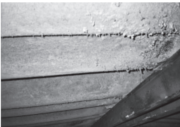
Figura 2. Placas de fibrocemento muy degradadas asimilables a material friable