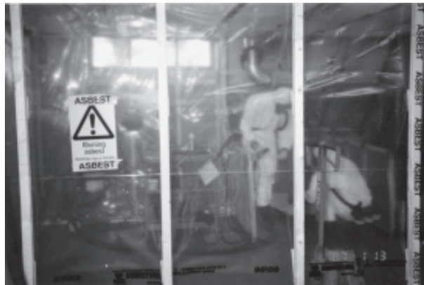
Figura 4. Montaje para obtener el adecuado aislamiento de un trabajo con amianto consistente en la sustitución de una arandela de caucho - amianto de un motor

En la figura 4 se expone un ejemplo de un montaje para obtener el adecuado aislamiento de un trabajo con amianto.